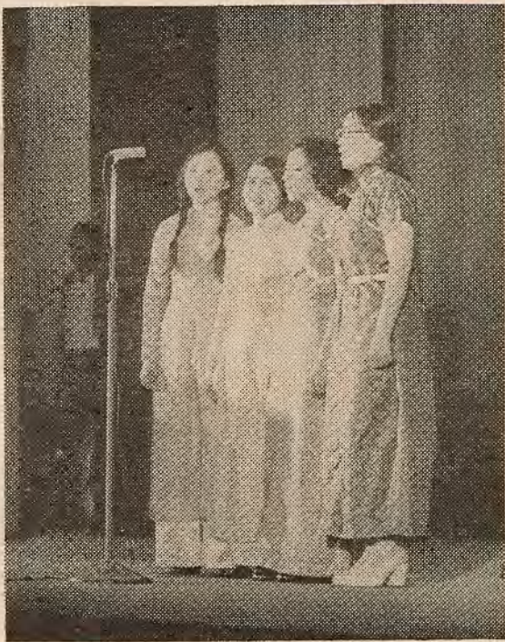
НА ЗДЫМКАХ: нашы танцы і песні табе, фестываль.