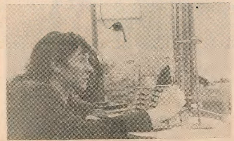
Ідучы заняткі на кафедры агульнай фізікі ў першакурснікам фізічна-га факультэта.